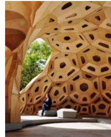
ICD (A. Menges) & IKTE (J.Knippers), ICD/ITKE Research Pavilion, 2011 Stuttgart University, 2011