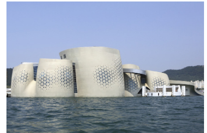
soma, Thematic pavilion Expo 2012 Yeosu, Corée du sud © soma

Créé en 1999, cet événement de notoriété internationale se donne comme un véritable laboratoire d'architecture, présentant à chaque édition les recherches les plus avancées en matière de création architecturale.