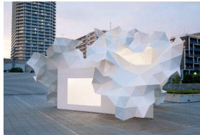
Akihisa Hirata Architecture Office, Bloomberg Pavilion, 2011