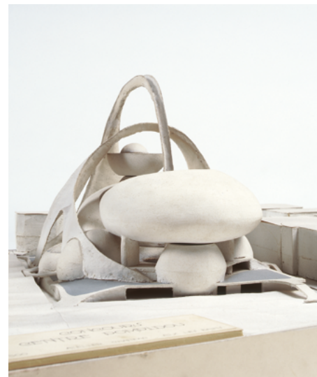
Chanéac, Centre Beaubourg (détail), 1974 Collection Frac Centre-Val de Loire

Derrière ces axes d'acquisition qui façonnent un idéal intangible de collection, se dessinent en filigrane les enjeux sociaux d'un monde en constante évolution. Chaque acquisition impose une nouvelle lecture, une nouvelle sensibilité qui bouscule une narration établie. Comment donner à entendre les voix non-occidentales ou à voir une architecture féminine ? Sous quelles formes se traduiront demain les urgences écologiques d'aujourd'hui ? Autant d'horizons pour une collection qui se questionne et se repense sans cesse.