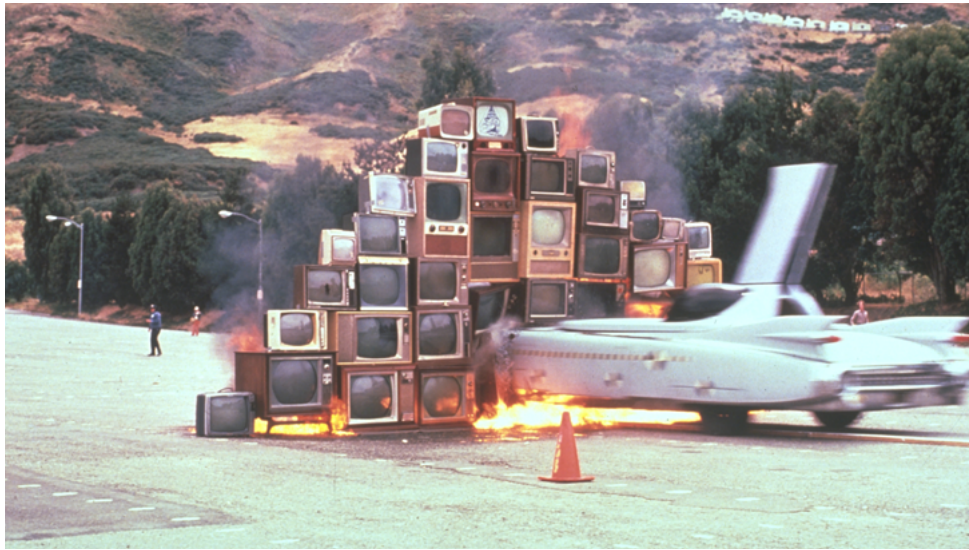
Ant Farm, Media Burn Item , 1975 Collection Frac Centre-Val de Loire