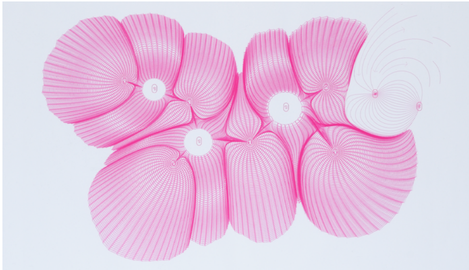
BIOTHING (Alisa Andrasek), Pavillon Seroussi, 2007 Collection Frac Centre-Val de Loire