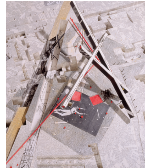
Daniel Libeskind, Berlin City Edge , Bauausstellung , Site Model (détail), 1987 Collection Frac Centre-Val de Loire