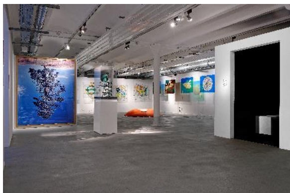
Exposition « Superstudio : Life after architecture », 2019.

Entièrement équipée en rails d'éclairage permettant de mettre en lumière l'ensemble de la galerie.