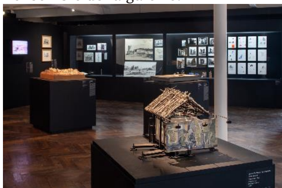
Exposition « Arkhé », 2018.

Entièrement équipée en rails d'éclairage permettant de mettre en lumière l'ensemble de la galerie.