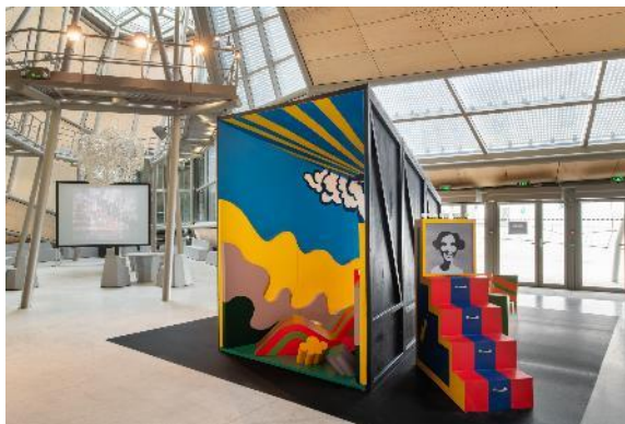
Exposition «Superstudio : Life after architecture », 2019.