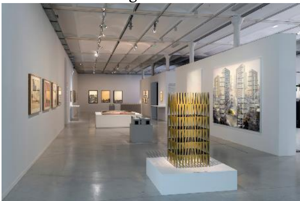
Exposition « Nos années de solitude », 2019-2020. 2018.

Entièrement équipée en rails d'éclairage permettant de mettre en lumière l'ensemble de la galerie.