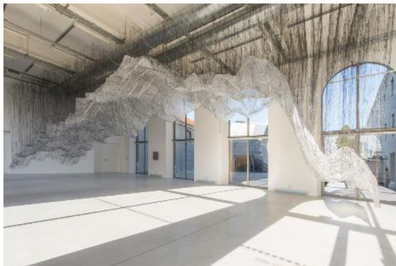
Exposition «reverse of volume FC - Yasuaki ©Frac Centre-Val de Loire