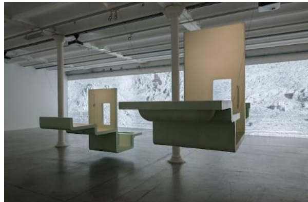
Exposition « The house for doing nothing »,