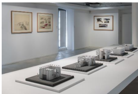
Exposition « la ville au loin », 2016.