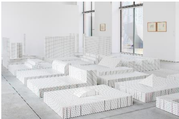
Exposition « Superstudio : Life after architecture », 2019. Onishi », 2015.

Eclairage naturel présent dans cet espace. La galerie est équipée de rails permettant un éclairage général en soirée.