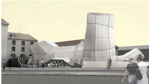
Jakob+MacFarlane Projet du FRAC Centre

La cour (600 m 2 ) est ouverte sur le boulevard. Pliage topographique, cette surface minérale met en tension l'architecture nouvelle des Turbulences et mène à un jardin (400 m 2 ) dans l'arrière-cour du bâtiment central.