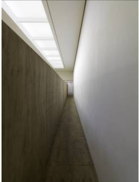
Mirosław Balka 190 x 90 x 4973 2008 Plywood, scaffolding and ash 74 13/16 x 35 7/16 x 1957 7/8 in. (190 x 90 x 4973 cm) © the artist