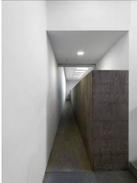
Mirosław Balka 190 x 90 x 4973 2008 Plywood, scaffolding and ash 74 13/16 x 35 7/16 x 1957 7/8 in. (190 x 90 x 4973 cm)